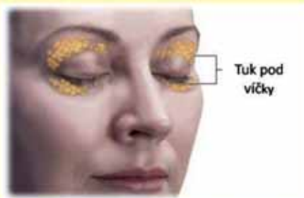
Tuk pod víčky

Plastická operace napomáhá k radikálnímu odstranění těchto projevů s velice efektním výsledkem. Kůže na očních víčkách začíná vytvářet převisy svým pozvolným uvolňováním a může docházet ke ztíženému pohybu víček či ke zvýšené únavě očí. Postupně s věkem se také zeslabují svalová vlákna a povolují vazivová pouzdra tukových tělísek – to časem umožní jejich výhřez do podkoží a vznikají nápadné váčky, které se zvětšují a poškozují kůži na víčkách. Ta se ztenčuje, stárne a zhoršuje se tím celkový výraz obličeje. K plastické operaci očních víček je velmi vhodné přistoupit již při výraznějším nadbytku kůže, dříve než nastanou výše popsané únavové příznaky. Operace by se neměla odkládat ani v případě, kdy se začnou na víčkách objevovat otoky po únavě, nevyspání, nebo naopak po dlouhém spánku. Při včasné odstranění tukových váček (prolapsů) zůstane kůže pružná a otoky, pokud nemají jinou příčinu, se trvale odstraní. Věk pro provedení operace je individuální, zpravidla se operuje od 35 let výše.